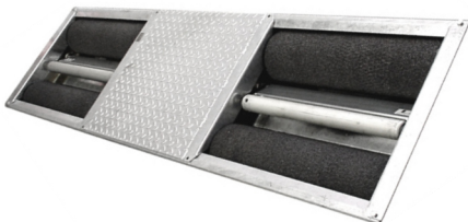
Banc de Suspension