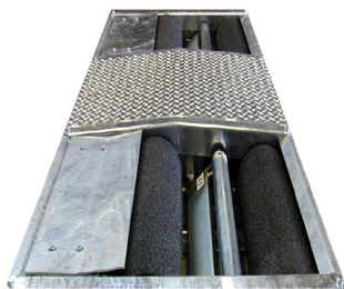
Plaque de Ripage